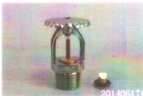
玻璃球上标有: Job FR 喷头总重: 58.96g